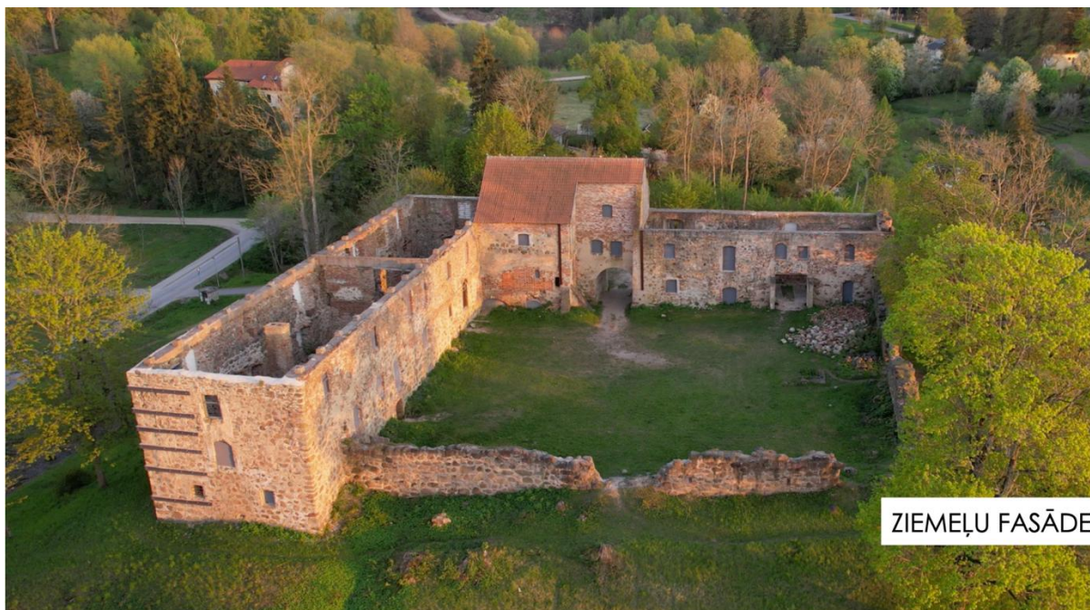
Aizputes Livonijas ordeņa pils

Aizputes Livonijas ordeņa pils ar nocietinājuma mūri ir valsts nozīmes kultūras (arhitektūras) piemineklis (Nr. 6396), kas atrodas Dienvidkurzemes novada Aizputē, pilsētas vēsturiskajā centrā, tā ir arī valsts nozīmes kultūras (pilsēt būvniecības) piemineklis (Nr. 7437). Savukārt kā Aizputes viduslaiku pilij tai ir piešķirts arī valsts nozīmes kultūras (arheoloģijas) pieminekļa statuss (Nr. 1277). Pils ir viena no senākajām kastellas tipa mūra pilīm Latvijā, celta 13. gadsimtā kā Livonijas ordeņa militāri-administratīvais centrs pie robežas ar Kurzemes bīskapiju. Gadsimtu gaitā tās funkcijas mainījušās – no ordeņa rezidences un militāra atbalsta punkta līdz muižas centram, cietumam, muzejam, arhīvam un dzīvojamai ēkai. Aizputes Livonijas ordeņa pils ir viena no ilgstošāk apdzīvotajām viduslaiku pilīm Latvijā – tā tika izmantota līdz pat 20. gadsimta 70. gadiem, kad to nopostīja ugunsgrēks.