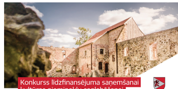
Konkurss līdzfinansējuma saņemšanai kultūras pieminekļu saglabāšanai