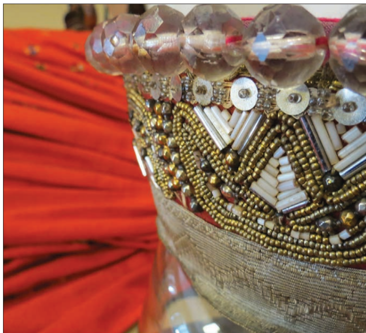
Nīca vairāk asociējas ar folkloras aktivitātēm, taču šoreiz tā svētkos izskanēs dzelzs ritmos.

"Tas bija kaut kas ārpus ierastā – jauna pieredze, kas radīja daudz pozitīvu emociju. Prieks dziedošo sievu acīs bija paties, un šo izjūtu vēlam nodot ikvienam bārteniekam – lepnumu par savu ciemu, tradīcijām un dziesmu," uzsver projekta īstenoātāji.