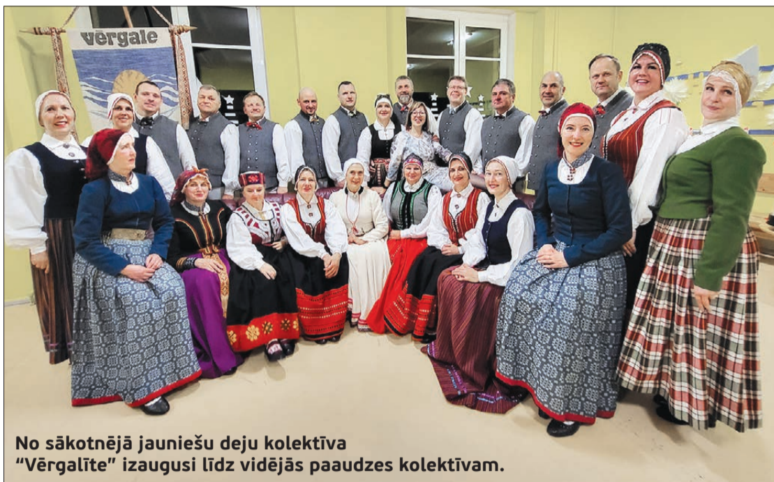
No sākotnējā jauniešu deju kolektīva “Vērgalīte” izaugusi līdz vidējās paaudzes kolektīvam.