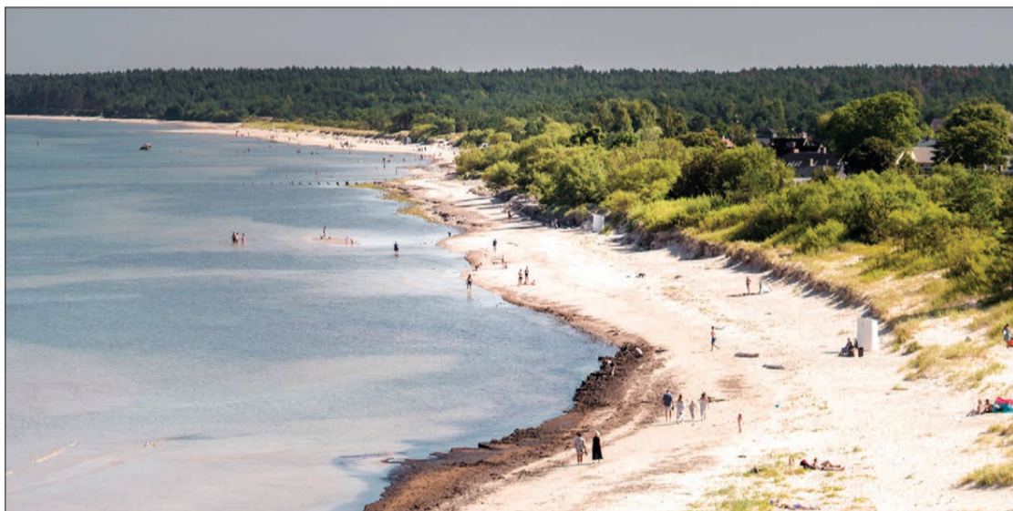
Visas paredzētās aktivitātes plānots realizēt pludmales sezonas laikā līdz 2026. gada 30. septembrim.