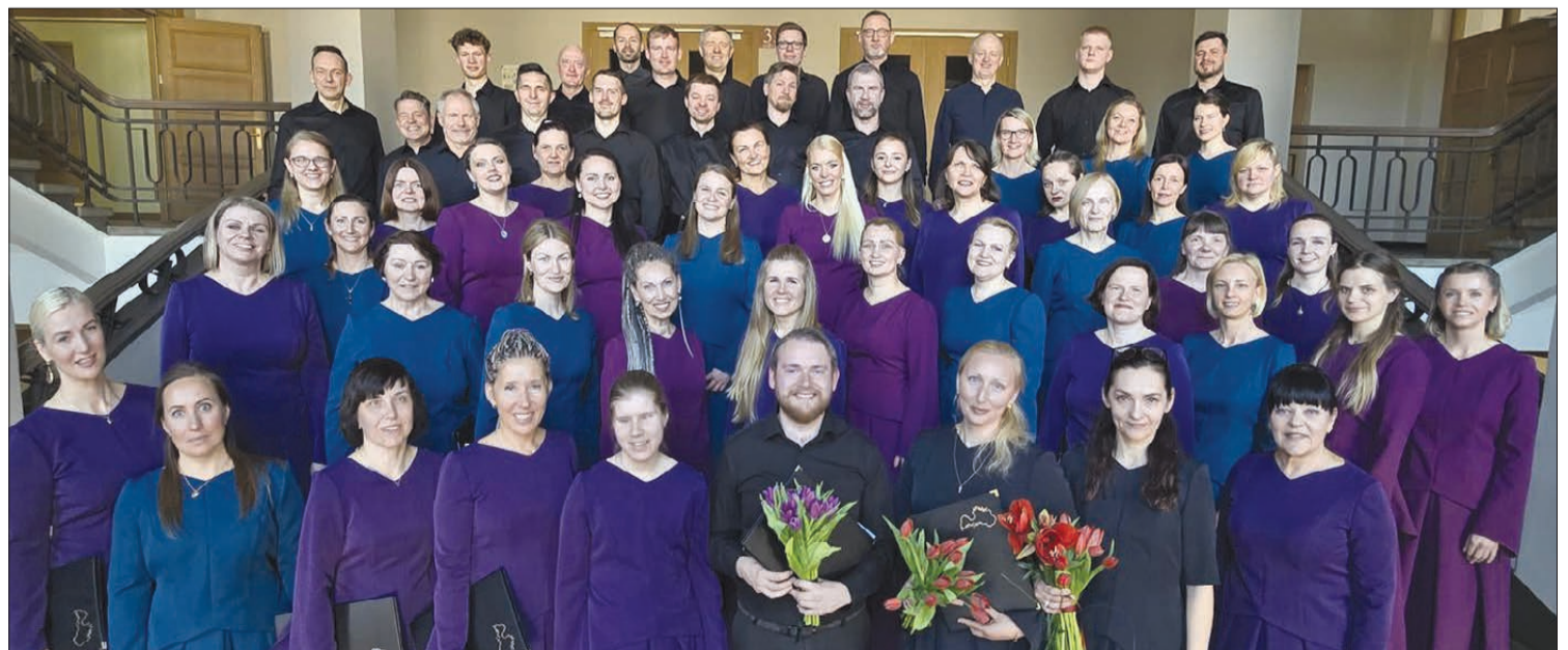
Korī "Apkārt Latvijai" apvienojušies cilvēki no dažādām mūsu valsts vietām.

Kora stāsts ir īpašs – ideja par tā izveidi radusies, ejot kājām apkārt Latvijai un dziedot pie uguns kuriem. Kopīgā pieredze, ceļā satiktie cilvēki un dziesmas kļuva par pamatu idejai izveidot kori. Oficiāli tas dibināts 2022. gada augustā, gatavojoties Vispārējiem latviešu