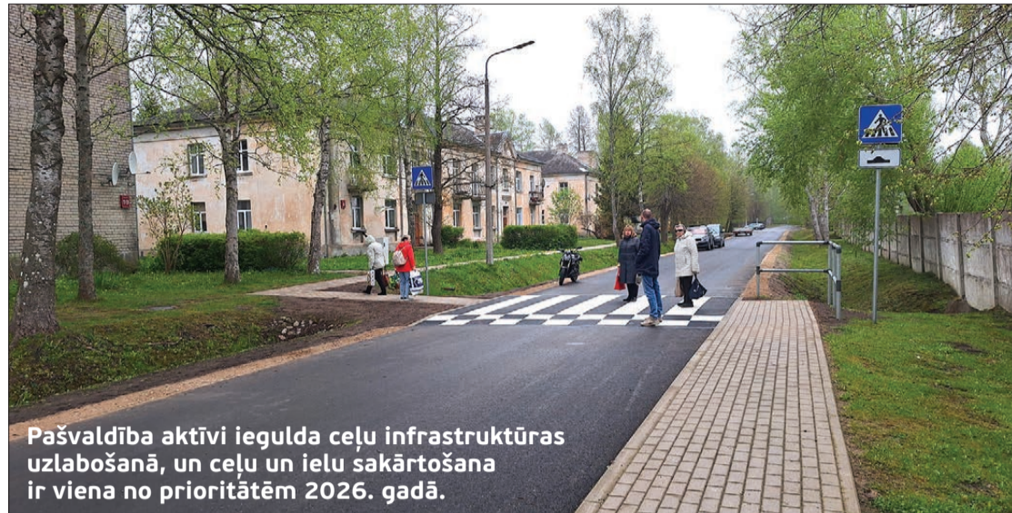
Pašvaldība aktīvi iegulda ceļu infrastruktūras uzlabošanā, un ceļu un ielu sakārtošana ir viena no prioritātēm 2026. gadā.

Dienvidkurzemes novadā sākti pirmie šīs sezonas ceļu un ielu sakārtošanas darbi.