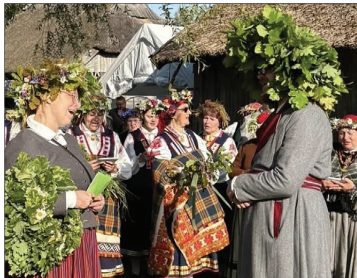
Saulgrieži ir vasaras skaistākie svētki.

Jāņu naktī kopā līgot Rucavas kultūrtelpā, Papes Ķoņu ciema “Vitolniekos”, aicina Rucavas tradīciju klubs un Latvijas Etnogrāfiskais brīvdabas muzejs.