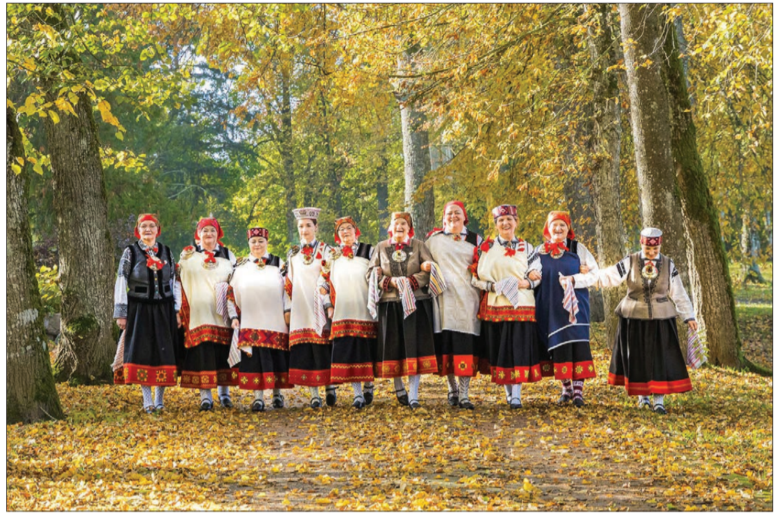
Ikvienam bārteniekam ir lepnums par savu pagastu un tradīcijām.

Bārtas pagastā īstenota skaista un nozīmīga iniciatīva – Dienvidkurzemes novada iedzīvotāju iniciatīvu konkursā atbalstītā projekta "Pastkarte no Bārtas" ietvaros tapušas īpašas pastkartes, kas atspoguļo Bārtas kultūras bagātību, tradīciju košumu un dziesmu spēku.